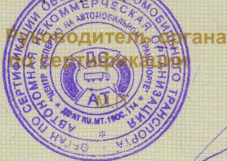
Схема сертификации № 1

(Handwritten signature in blue ink) (подпись)